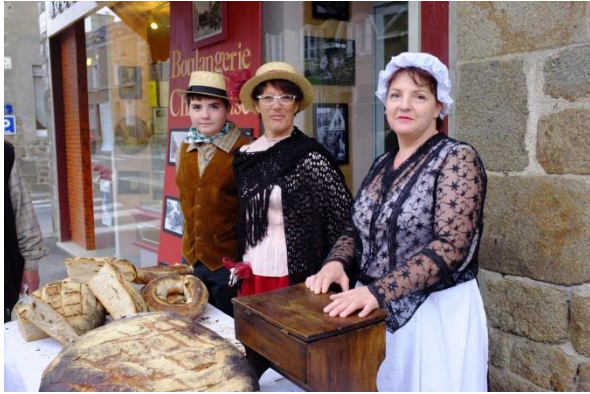
Et dégustation du beurre sur une bouchée de pain de 6 livres cuit pour l'occasion.