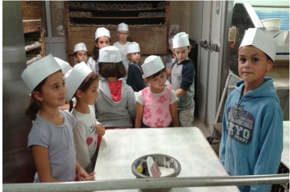
Animation à boulangerie Desmarioux avec costumes d'antan et un atelier pour les enfants...